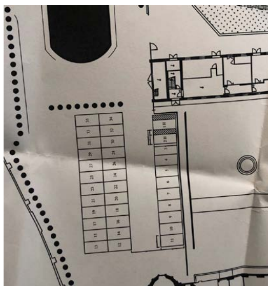
IPOTESI B (circa 35 posti auto)

In entrambi i casi il numero dei parcheggi autorizzati sarebbe molto ridotto rispetto all'attuale, con una riduzione prevista max (caso A) in principio superiore al 60%.