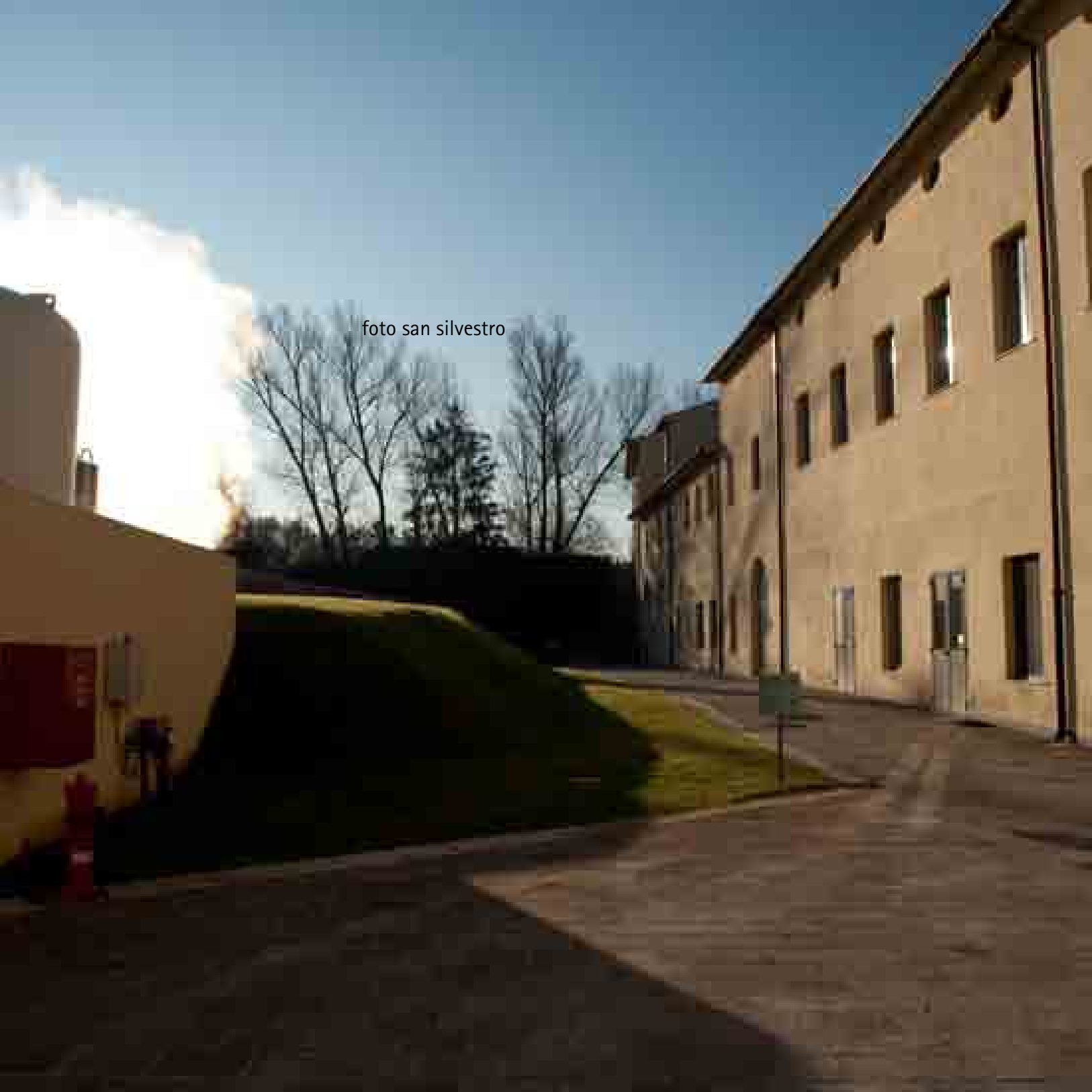
foto san silvestro