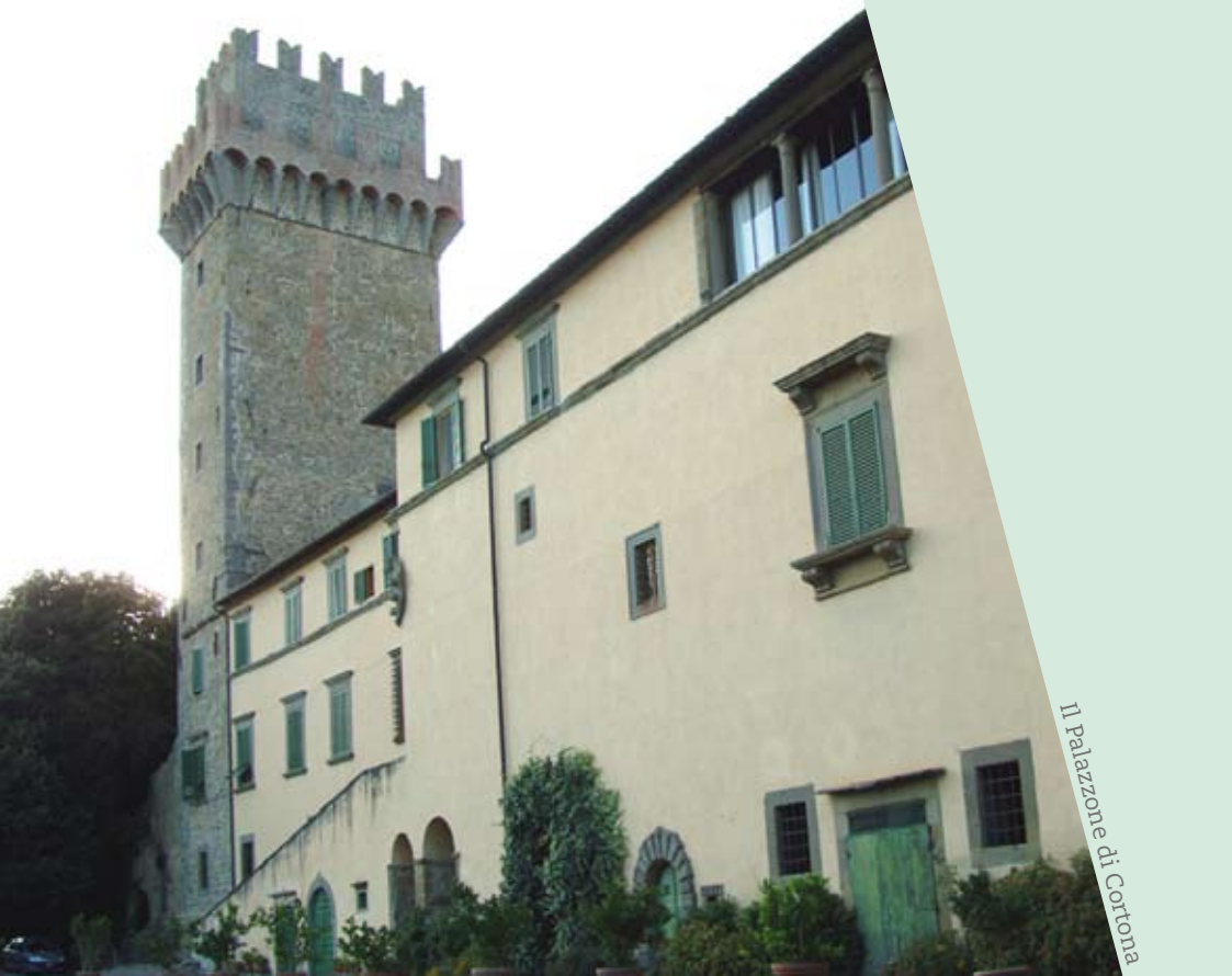
Il Palazzo di Cortona