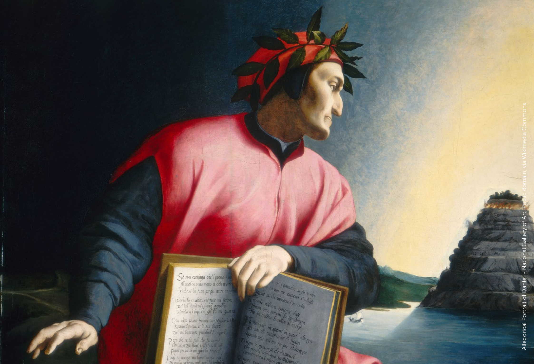
Allegorical Portrait of Dante - National Gallery of Art - Public domain, via Wikimedia Commons