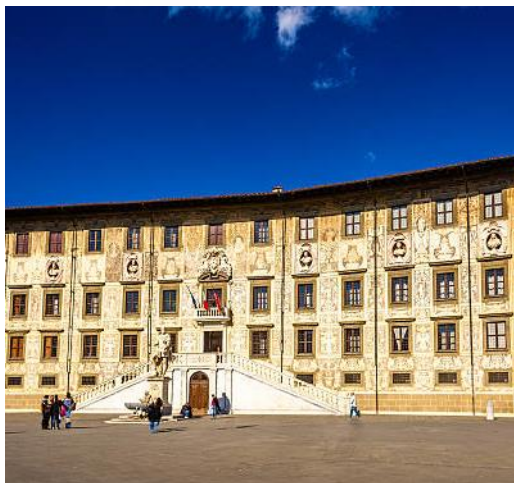
Scuola Normale Superiore – Sede di Pisa