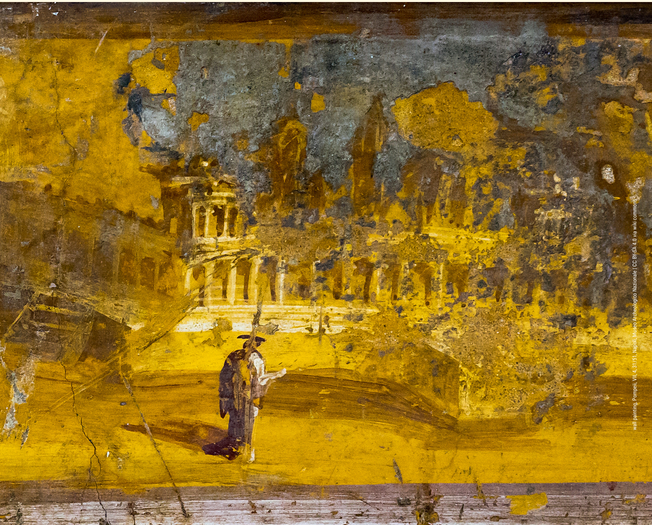
wall painting, Pompeii, VII, 4, 31/51, Napoli, Museo Archeologico Nazionale | CC BY-SA 4.0 via wiki commons